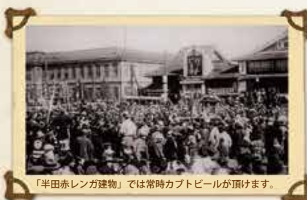
「半田赤レンガ建物」では常時カブトビールが頂けます。