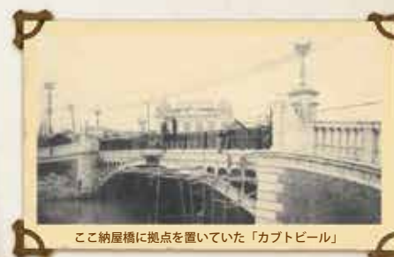
ここ納屋橋に拠点置いていた「カブトビール」